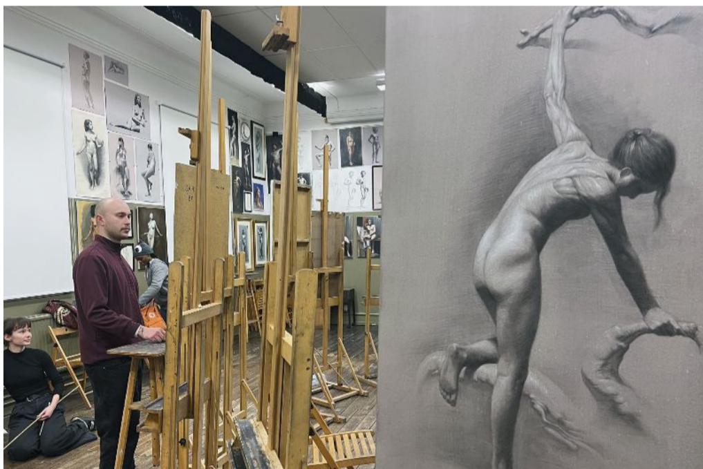
I The Swedish Academy of Realist Art erbjuder detaljerade studier av den mänskliga figuren, där modellerna intar samma pose under en längre tidsperiod.

– Vi blir ibland inbjudna av lokala gymnasieskolor att komma och berätta om realistiskt måleri och akademiens olika utbildningar. Men det finns också skolor med estetiska program på gymnasienivå som inte är intresserade av att bjuda in oss. Det verkar finnas en attityd att det är bakåtsträvande att lära sig en viss arbetsmetod och att det begränsar kreativiteten.