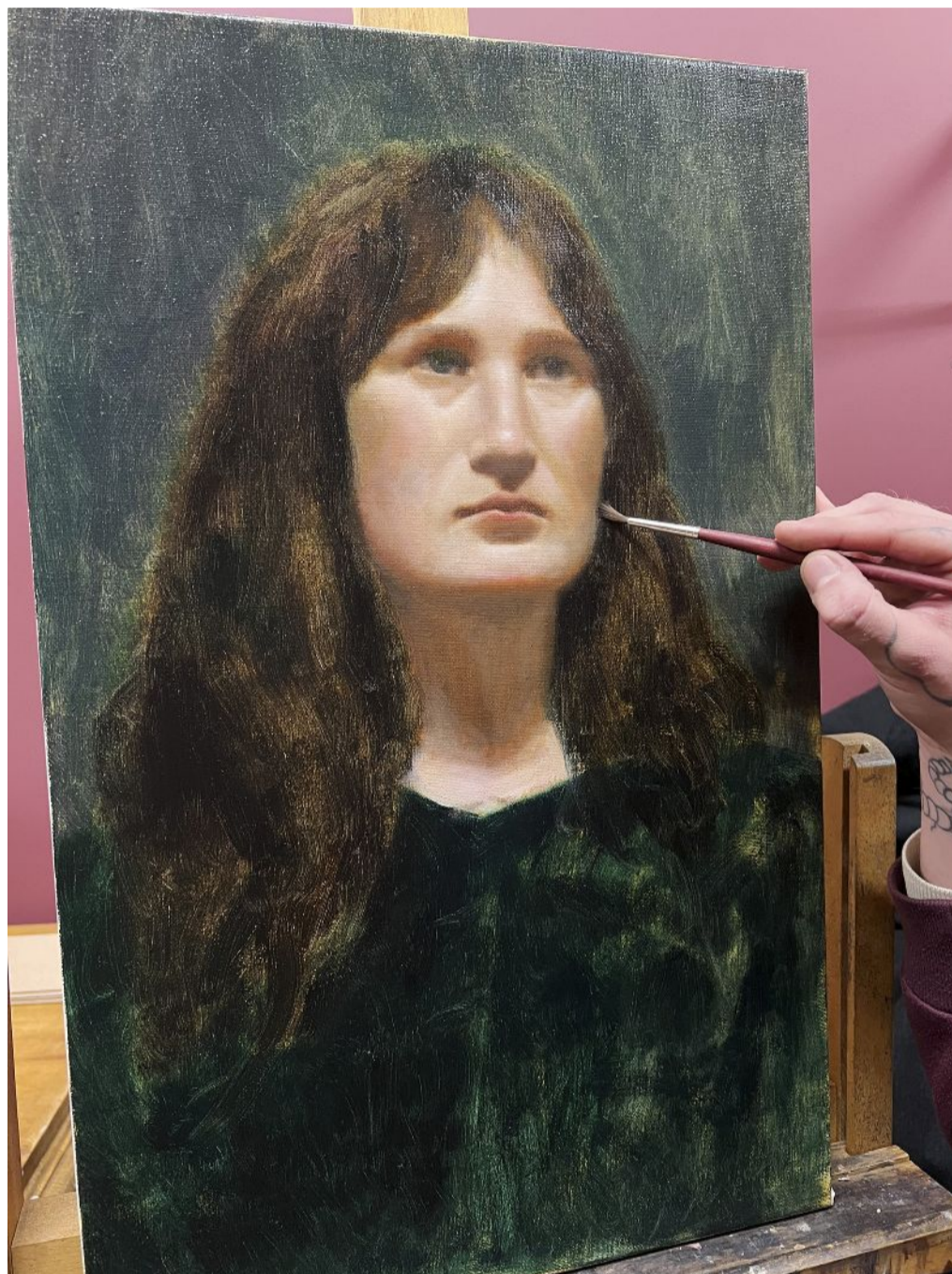
Eleven uppmuntras till att utveckla sin kreativitet och fantasi, eftersom det är kvaliteter som kan lyfta en målning bortom enbart teknisk excellens.

”Genom utbildningen lär vi oss att observera, vilket för mig är den ultimata träningen i att vara närvarande i tillvaron.”